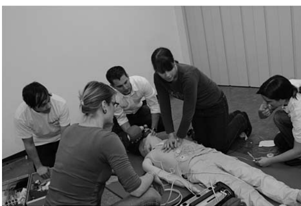
Abb. 3: