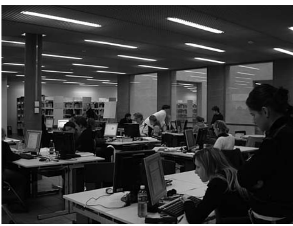
Abb. 2:

Welche konkreten Auswirkungen das auf die gemeinsame berufliche Praxis haben wird, kann zu der Zeit nur vermutet werden. Fest steht jedoch, dass das gemeinsame Lernen, Lehren und Arbeiten weiter ausgebaut werden muss und die Umsetzung von Interprofessionalität eine gemeinsame Aufgabe der Bildungsinstitutionen und der Institutionen der beruflichen Praxis ist.