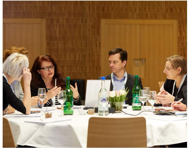
Die Teilnehmenden des Dialogs diskutieren Handlungsempfehlungen.

Die digitale Transformation stellt gewaltige organisatorische, rechtliche und wirtschaftliche Herausforderungen an die Gesundheits-, Sozial- und Bildungssysteme. Sie soll zwischenmenschliche Interaktion vereinfachen, begleiten und unterstützen sowie die Lebensqualität aller Betroffenen fördern. Der Careum Dialog 2018 beleuchtete die digitale Transformation in der Pflege aus verschiedenen Perspektiven.