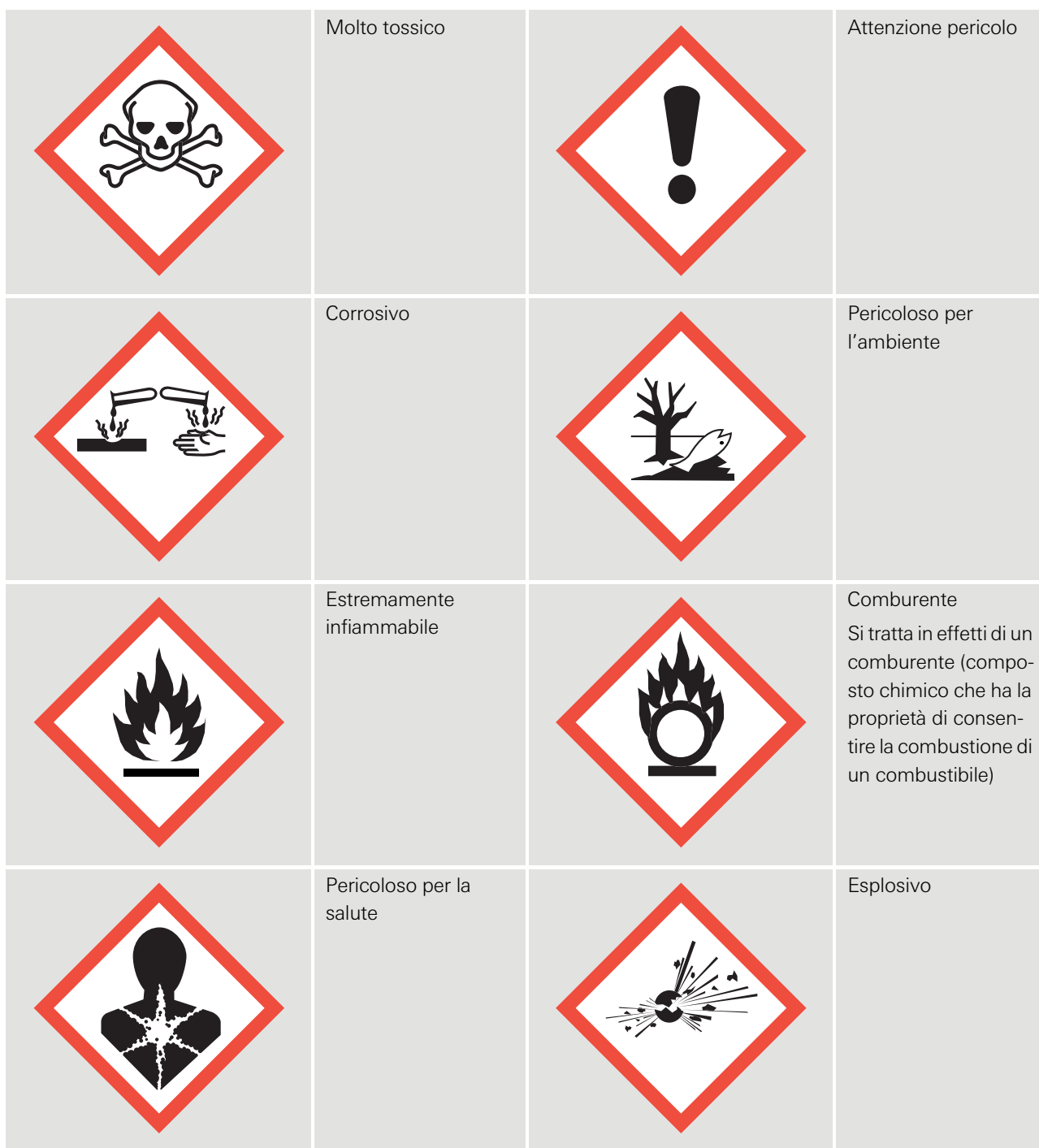
Illustrazione 4 Simboli di pericolo che figurano sui prodotti

Quando si fa pulizia o, in generale, nell'ambito delle attività domestiche si usano talvolta alcuni prodotti pericolosi. Esistono norme legali destinate a proteggere le persone dalle sostanze tossiche. Sui prodotti possono figurare indicazioni o avvertenze, come pure simboli di pericolo. Dovete dunque prestare particolare attenzione a tali simboli quando acquistate e usate i prodotti in questione (peraltro va notato che i prodotti che non recano alcuna indicazione precisa non sono esenti da rischi).