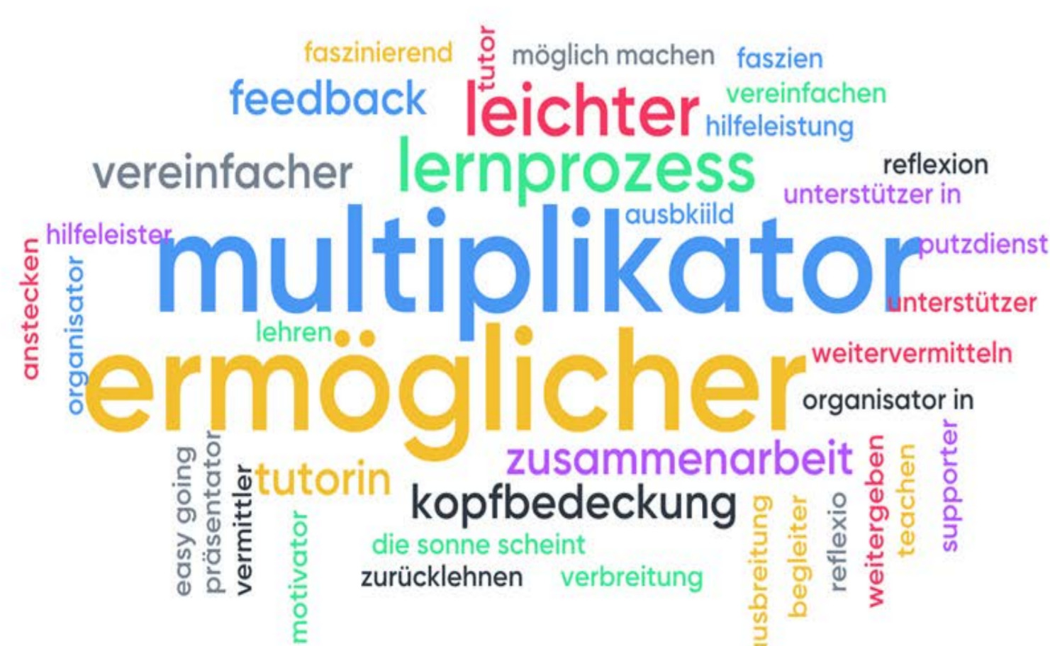
Abb. 2: Word Cloud mit Assoziationen einer Teilnehmergruppe

Woran denken Sie beim Wortbegriff Facilitator?