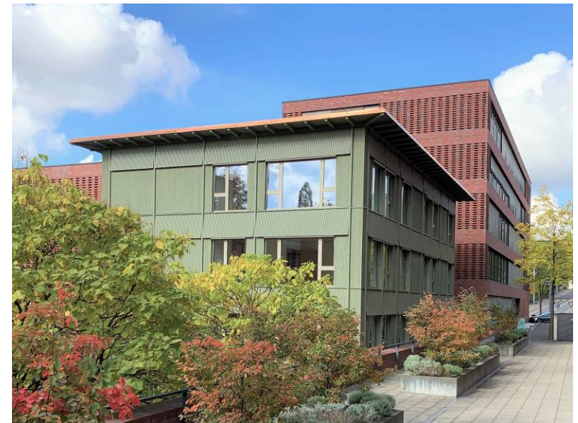
Fotoaufnahme 13. Oktober 2020